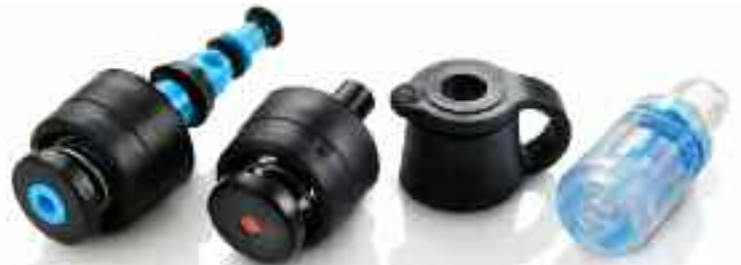
FÜR OLYMPUS- ENDOSCOPE

Der beste Schutz für Ihre Patienten durch Wegfall des langwierigen Aufbereitungsverfahrens, das bei wiederverwendbaren Ventilen erforderlich ist.