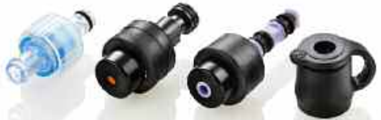
FÜR PENTAX- ENDOSCOPE